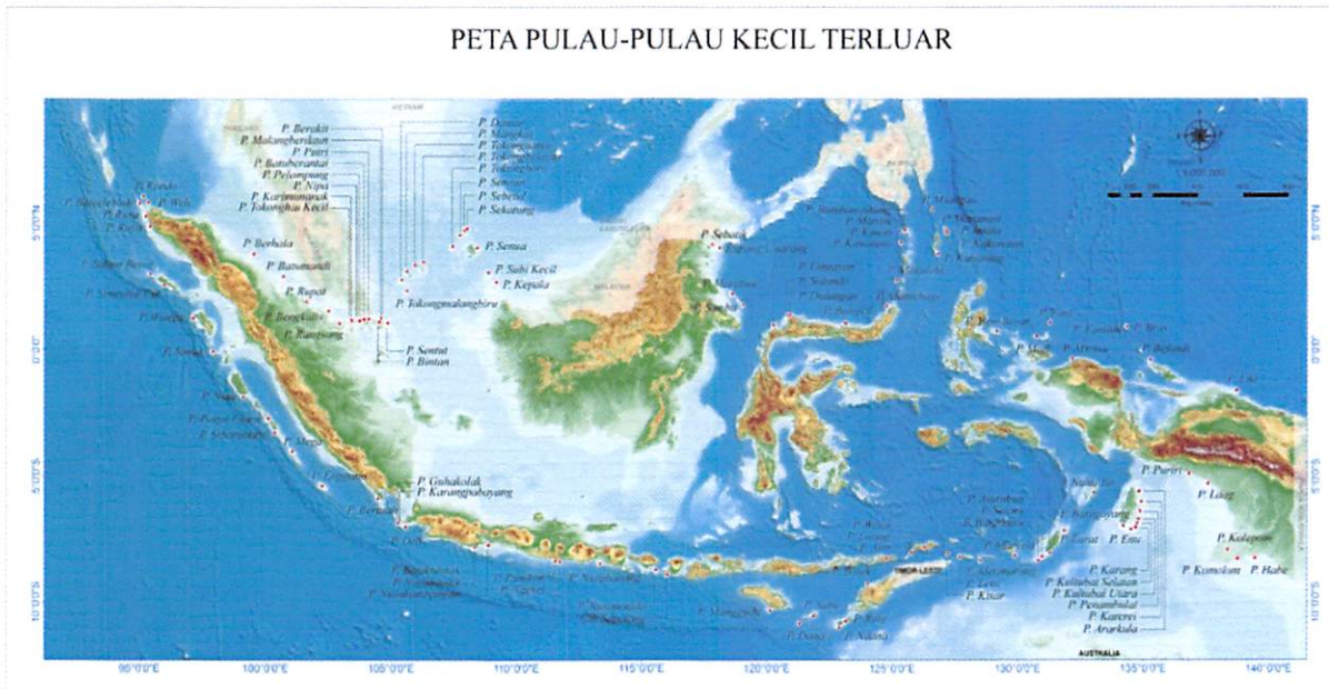
PETA PULAU-PULAU KECIL TERLUAR