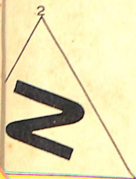
VIRAGE HARP TURN.